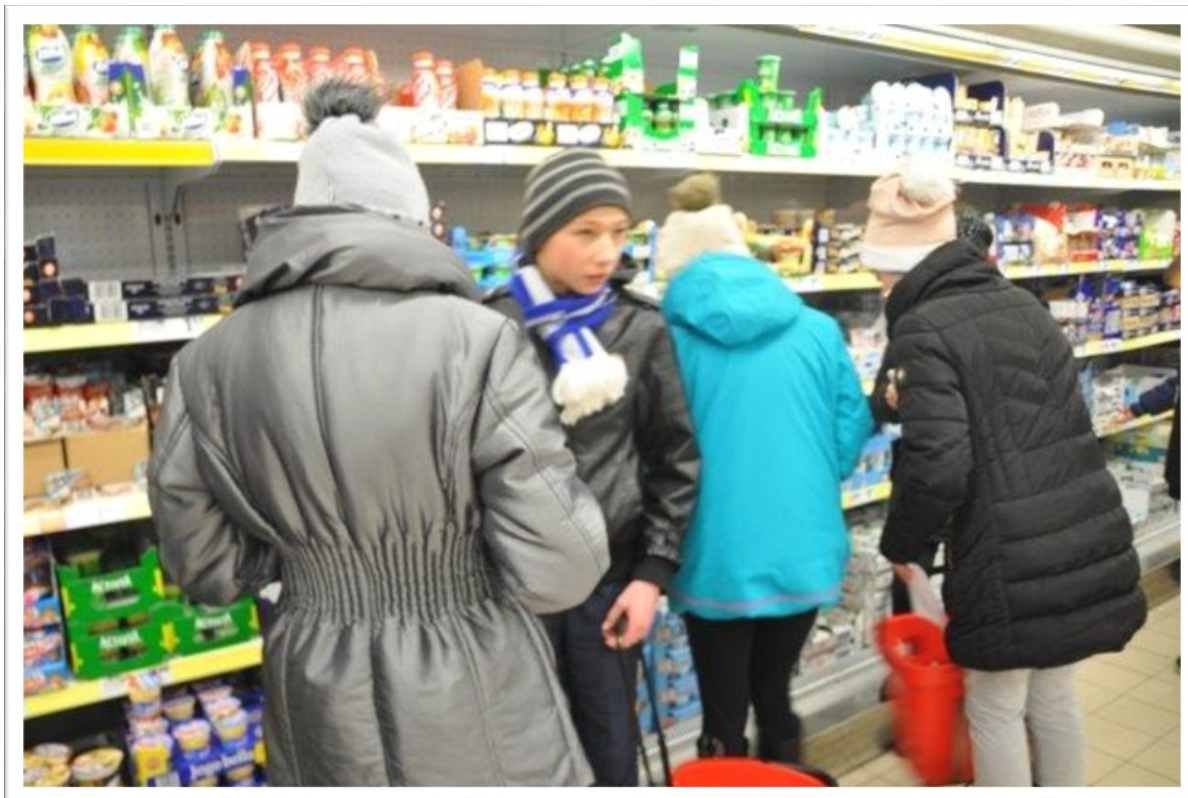
Uczniowie klasy VI a w roli konsumentów