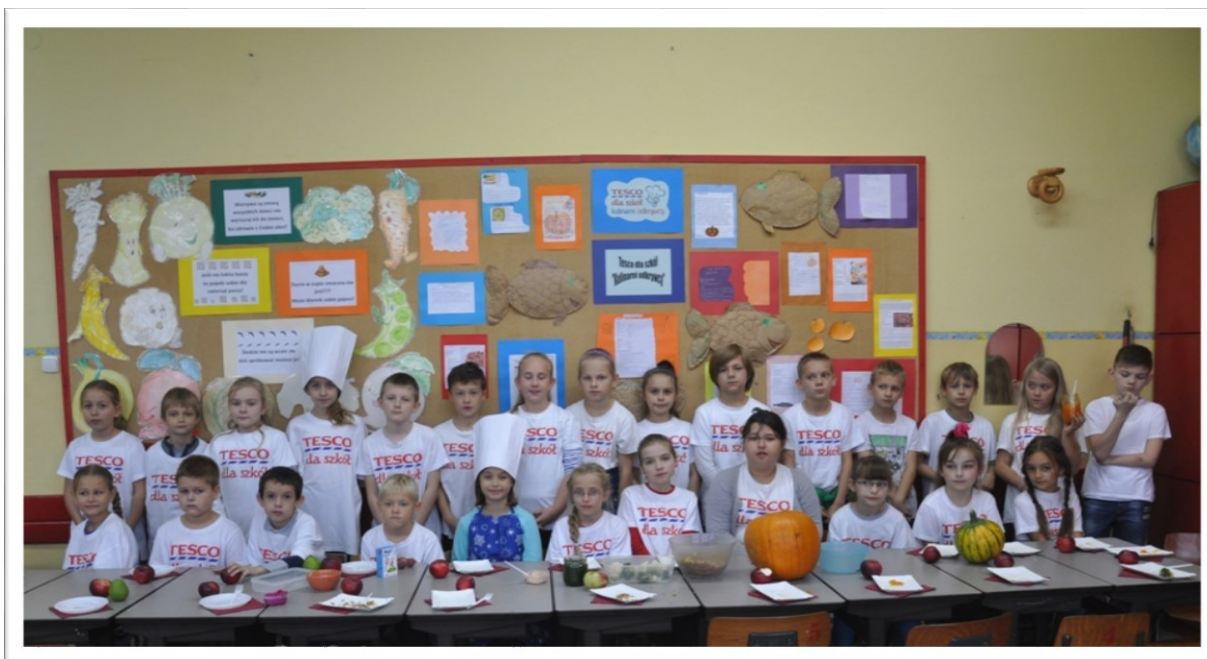
Uczniowie kl. III b - uczestnicy konkursu „Kulinarni odkrywcy”

Dodatkowo od października do grudnia 2014 r. uczniowie klas I a i III b wraz z wychowawcami uczestniczyli w konkursie Tesco dla Szkół – „Kulinarni odkrywcy” . Konkurs miał na celu uświadomić uczniom, że gotowanie nie musi wcale być trudne ani monotonne. Uczniowie musieli nakręcić filmik, przygotować gazetki ścienne, mogli również sprawdzić swoją wiedzę nt. zdrowego żywienia rozwiązując zadania i quizy na stronie www.tescodlaszkol.pl . Uczestnictwo w konkursie pozwoliło uczniom zobaczyć jak wygląda gotowanie poczynając od wykonania świadomych zakupów poprzez poznanie zasad zdrowego racjonalnego żywienia, a kończąc na kulinarniej zabawie.