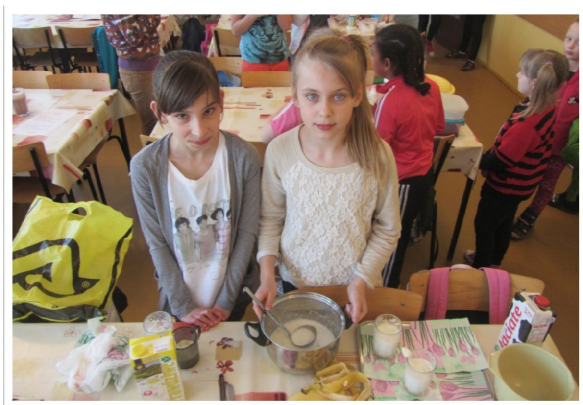
Szkolny konkurs kulinarny „Potrawy z mleka”

Nasza szkoła bierze udział w programie „ Mam kota na punkcie mleka ”. Został on zainicjowany przez Polską Izbę Mleka we współpracy z Polską Federacją Hodowców Bydła i Producentów Mleka. Skierowany jest zarówno do dzieci, jak i rodziców oraz nauczycieli. Jego celem jest zwiększenie wiedzy dzieci na temat odżywczych walorów mleka oraz jego przetworów. Misją akcji w naturalny sposób łączy się z potrzebą kształtowania prawidłowych nawyków żywieniowych i promowania aktywnego stylu życia wśród dzieci. Działania zaplanowane są na trzy lata (do sierpnia 2015 r). Uczestniczą w nich uczniowie obecnych klas V i VI. W ramach programu uczniowie uczestniczyli w cyklu zajęć ( 3 x 45 minut) poprowadzonych przez nauczycieli przyrody według scenariuszy opracowanych przez autorów programu, mieli możliwość wzięcia udziału w konkursach klasowych i międzyszkolnych organizowanych w szkole oraz na stronie internetowej www.mamkotanapunkciemleka.pl , rodzice natomiast otrzymali materiały edukacyjne.