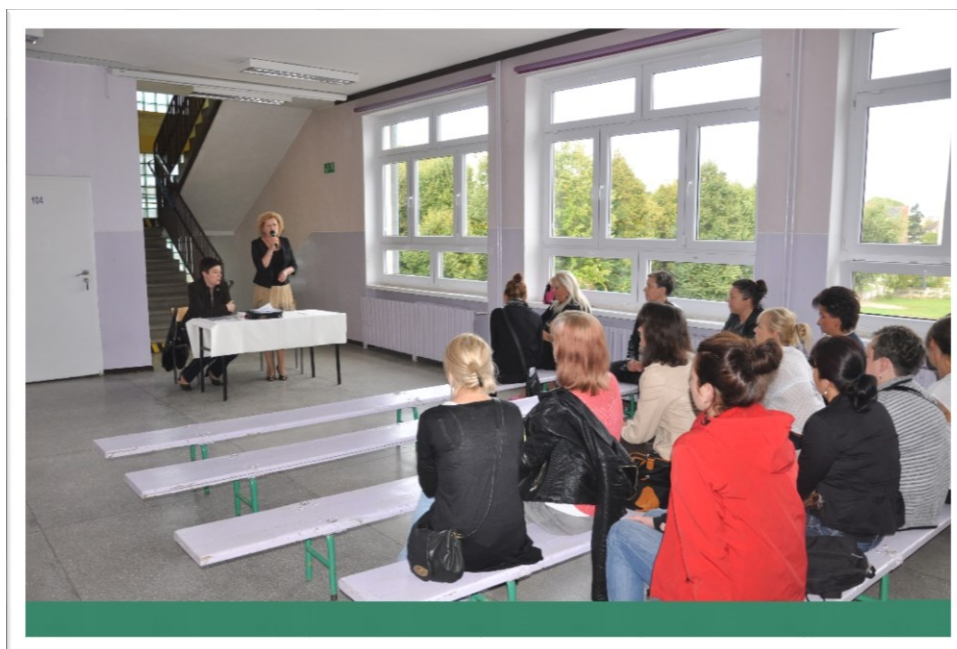
Spotkanie z rodzicami „Niedostosowanie społeczne dziecka, izolacja w grupie, agresja” 10 września 2014 r.